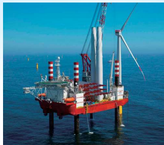
SEP船 (自己昇降式作業台船・自航式)