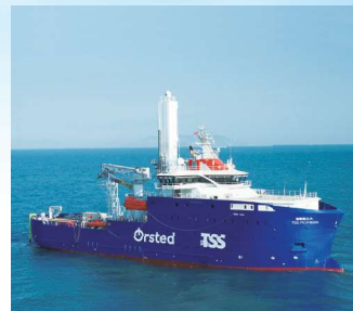
SOV (洋上風力向けオフショア支援船)