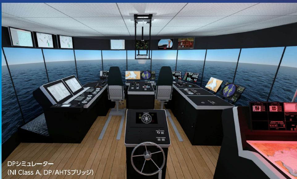
DPシミュレーター (NI Class A, DP/AHTSブリッジ)

このコースを修了すると、NIが認証するDPO資格取得のための訓練修了書はもちろん、DPに関するトップクオリティの知識や操船技術を習得することができます。